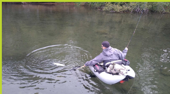
Fête de la pêche à la mouche au lac du Bouchet 2018

Fête de la pêche à la mouche au lac du Bouchet*