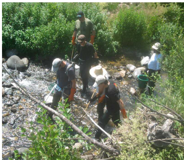
Photo : opération de pêche électrique

la bageasse, panneautage Loire, parcours trophée, panneautage frayère sur la Loire (chadron-Goudet)...