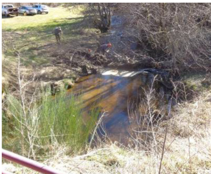
Embâcles avant travaux sur la Senouire

Par exemple, on a pu lire dans la presse locale les opérations menées par l'A.A.P.P.M.A. de Vorey sur Arzon, sur les bords de Loire, ou bien l'A.A.P.P.M.A. de St pal de Senouire qui s'est organisée pour entretenir les berges de la Senouire et supprimer des embâcles le 22 février (voir illustration).