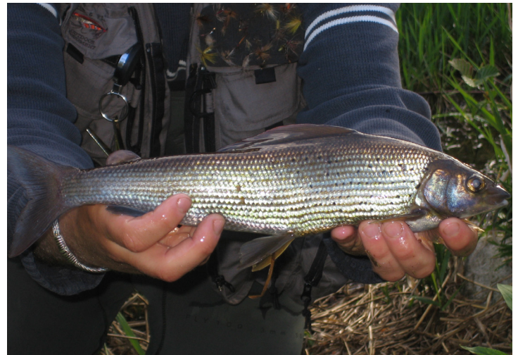
Ombre commun à venir découvrir sur l'Allier cet automne

Un bilan sera établi par le service technique pour évaluer la réussite de ces opérations et la poursuite éventuelle de ce programme en tenant compte des résultats disponibles et des attentes de tous les acteurs.