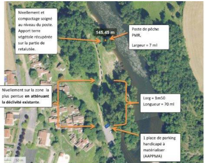
Schéma de principe des travaux (P. ROA – Fédération 43)

La labellisation interviendra par la suite, le dossier réalisé par le service technique a reçu un accord de principe de la FNPF.